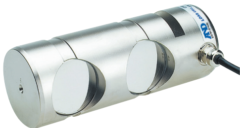
※ 주문 제작 방식