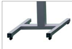
이동형 스탠드 인디케이터 이동형 받침대(옵션)