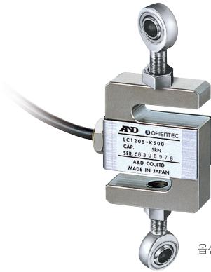
옵션 : Rod end Bearing