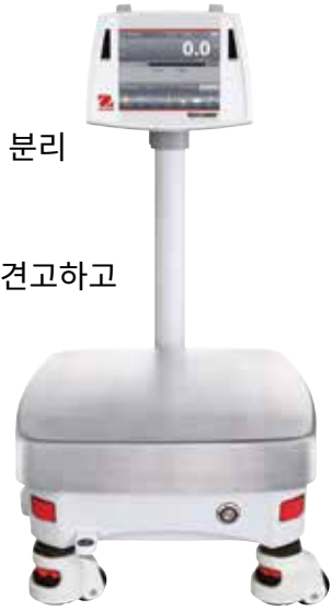
Shown with optional tower mount and rolling feet